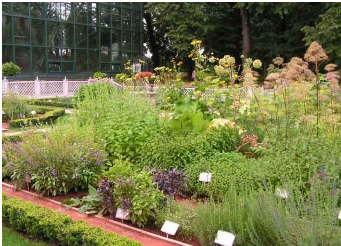
Сад лекарственных трав