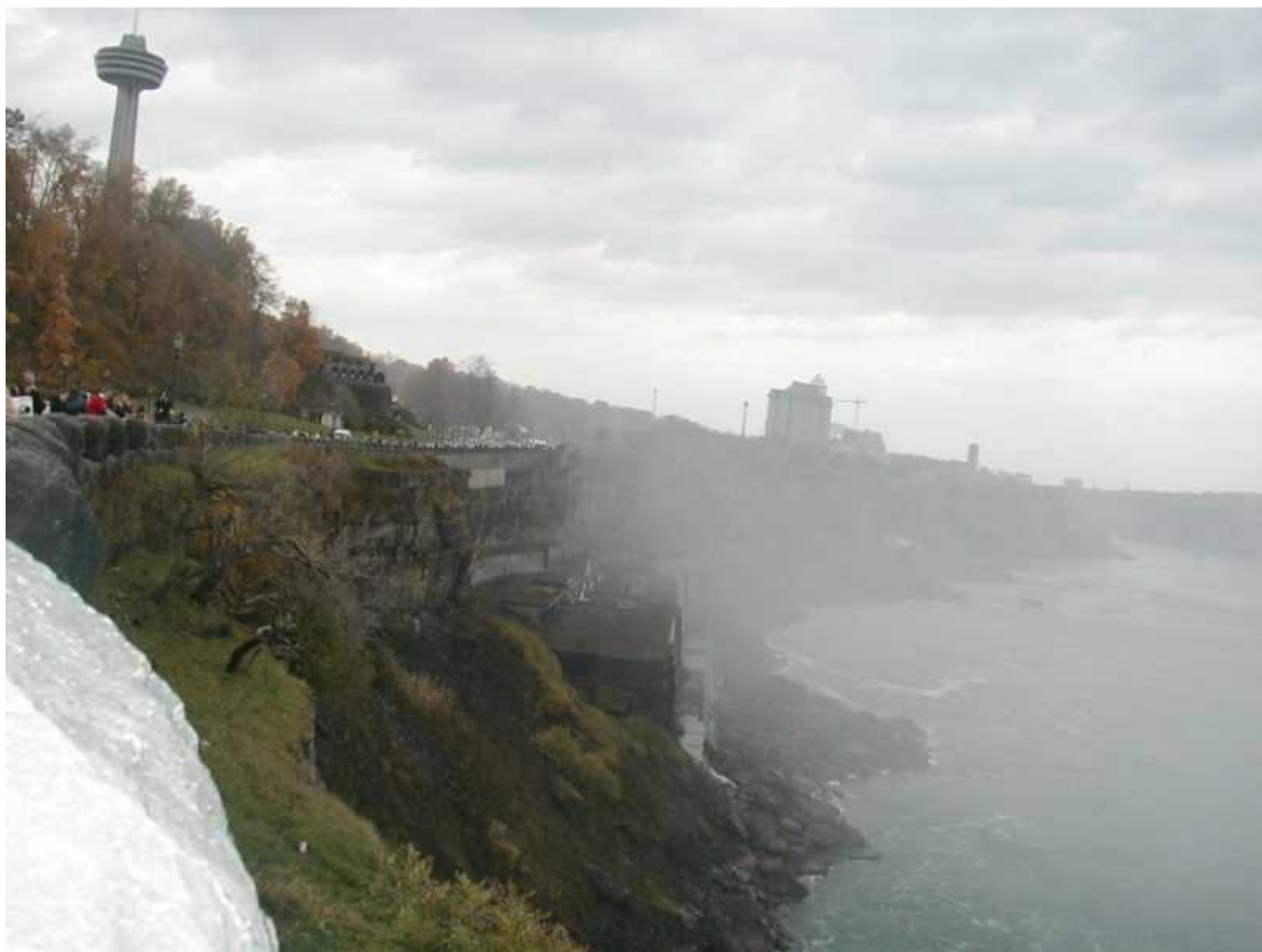
Смотровая площадка на Канадской стороне