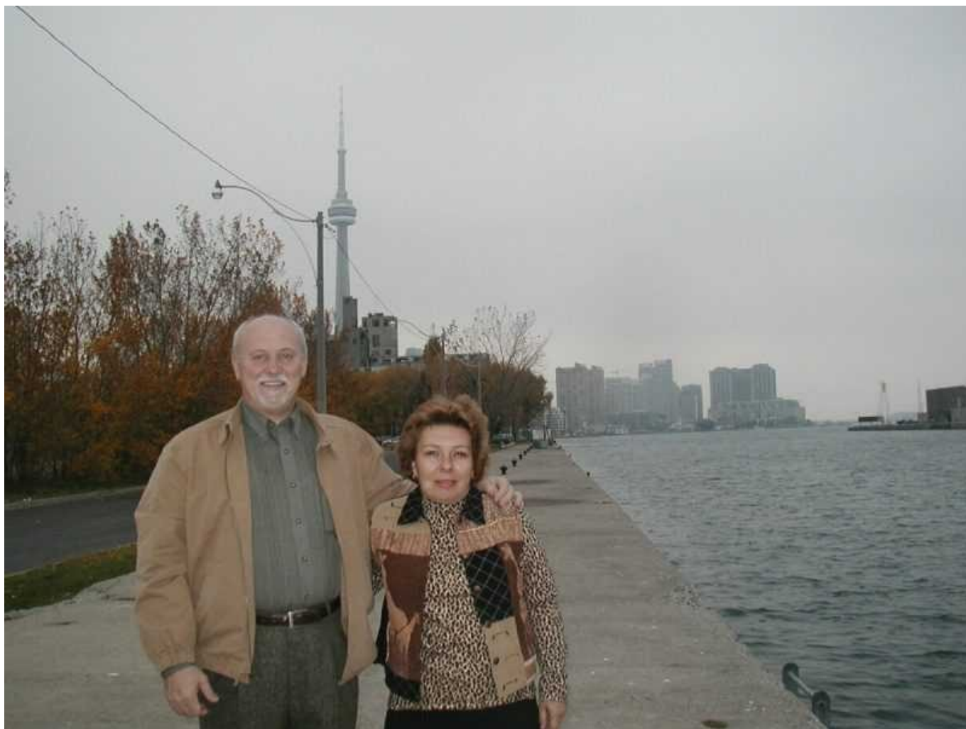
На набережной озера Онтарио в Торонто

Мы зашли в Зал хоккейной славы, расположенный в подвальном помещении старинного особняка с галерейной пристройкой.