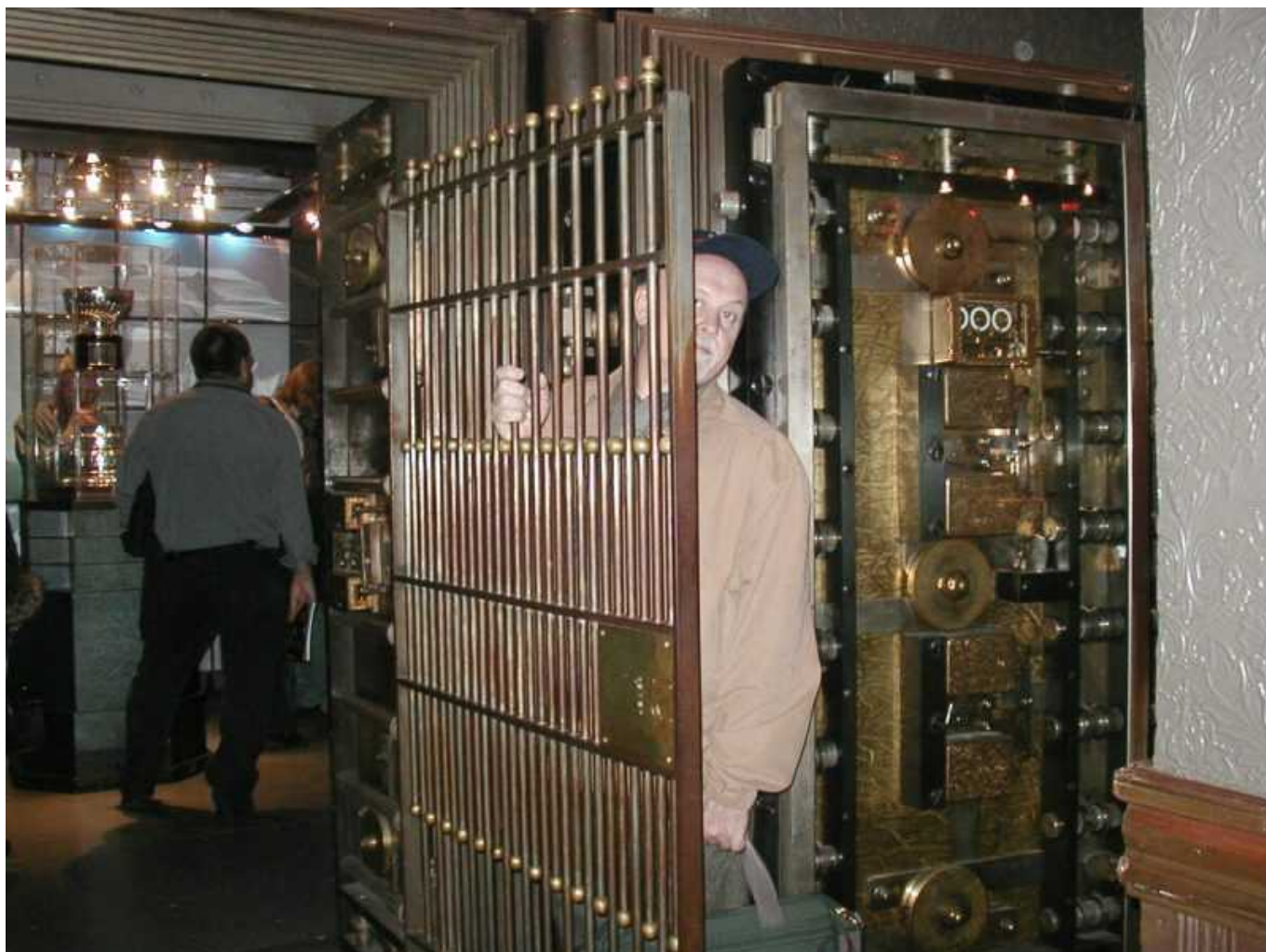
Сейфовая дверь, за которой хранится кубок Стэнли

Сам кубок – небольшая серебряная чаша, а постамент высится за счет металлических лент вокруг постамент, на которых выбиты названия победивших команд.