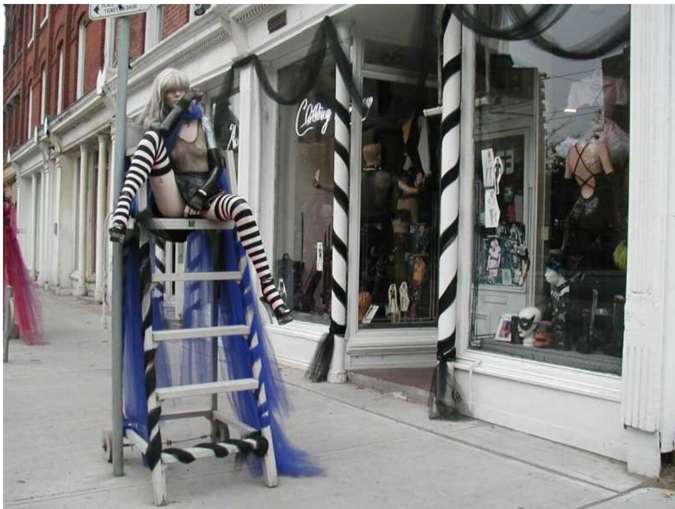
Реклама на улицах Торонто

Как нам сказали, Торонто стал особенно процветать со времени обострения сепаратизма в Квебеке – англоязычный бизнес перебрался в Торонто, но смотреть особенно нечего – город новый, а для туристов оставлена Queen street – длинная улица с двухэтажными старыми домиками и множеством мелких лавок, почему-то по преимуществу торгующих тканями.