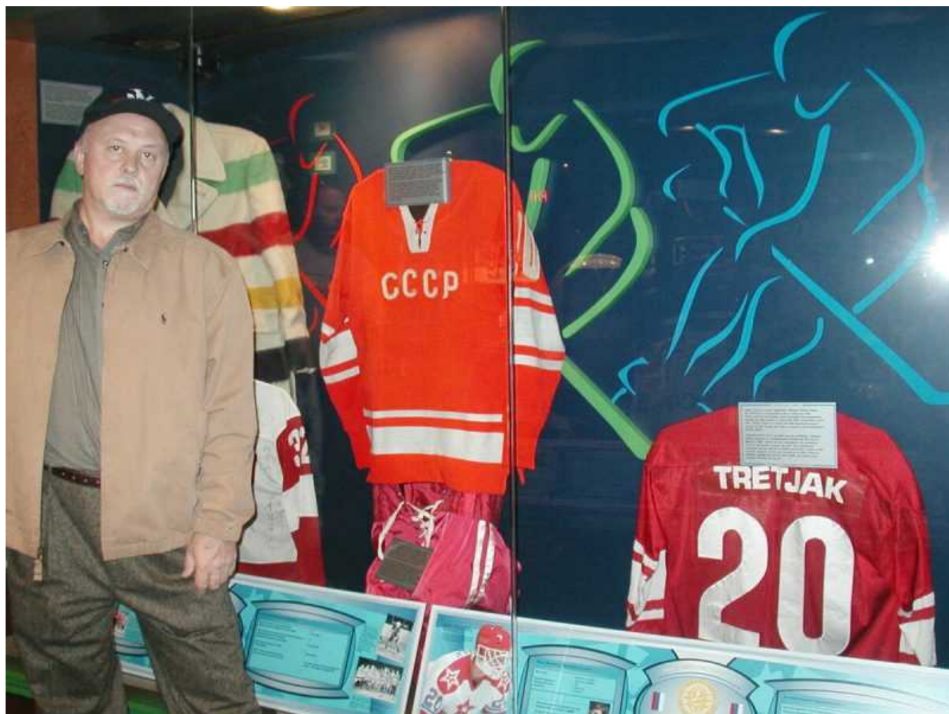
У стенда В.Третьяка

Зал набит хоккейной формой, клюшками, шайбами, коньками, но экспозиция с точки зрения рассказа об истории хоккея носит довольно убогий характер – детский сад.