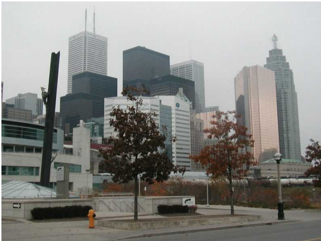
Небоскребы в Торонто

поскольку часть пути ехали через центр города, в котором не имеют представления о «зеленой волне». На следующий день погода уже «не шептала» – было холодновато и мрачно, поэтому катались на машине. В отличие от Квебека, Монреаля и Оттавы, город очень американизированный, со множеством небоскребов.