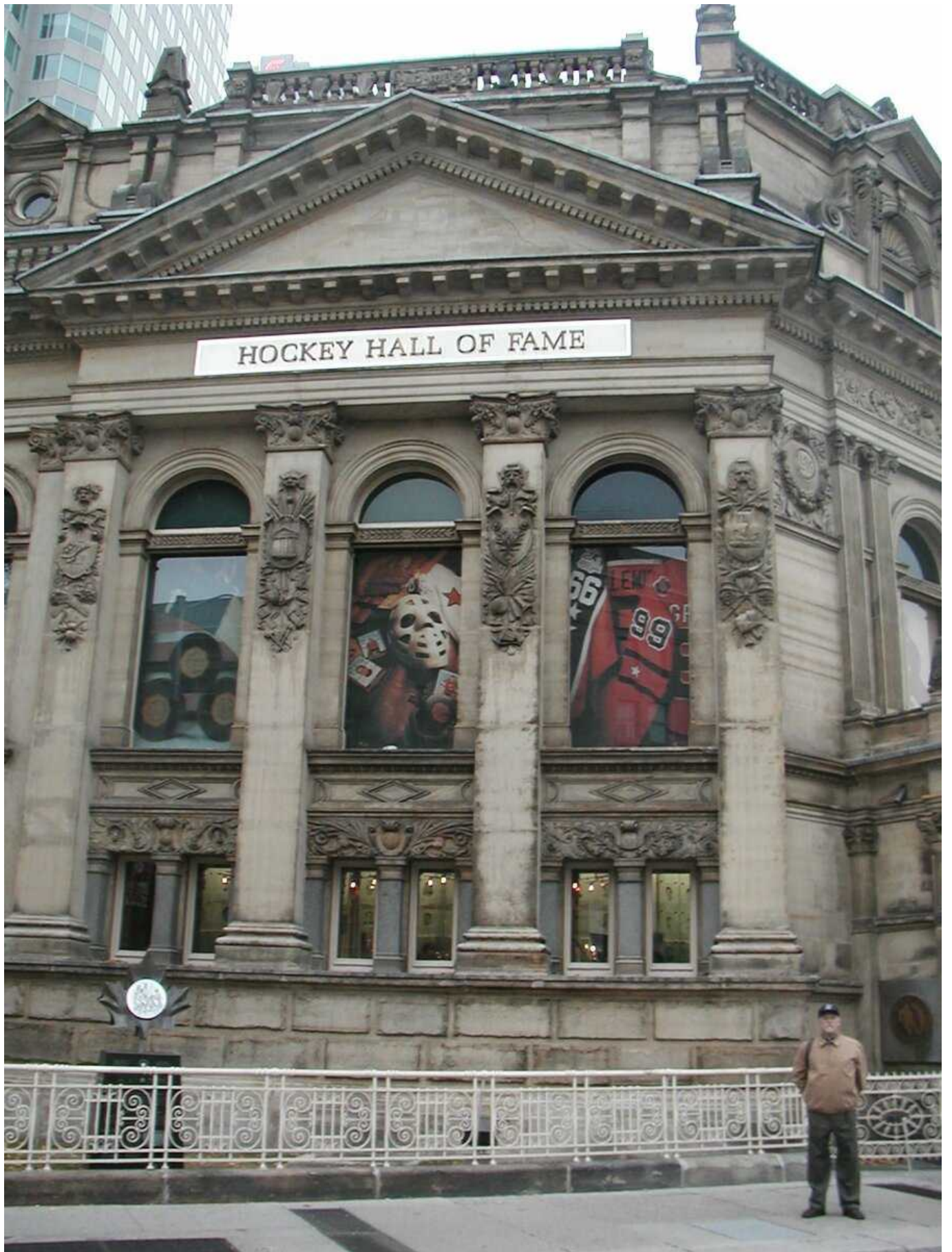
Зал хоккейной славы