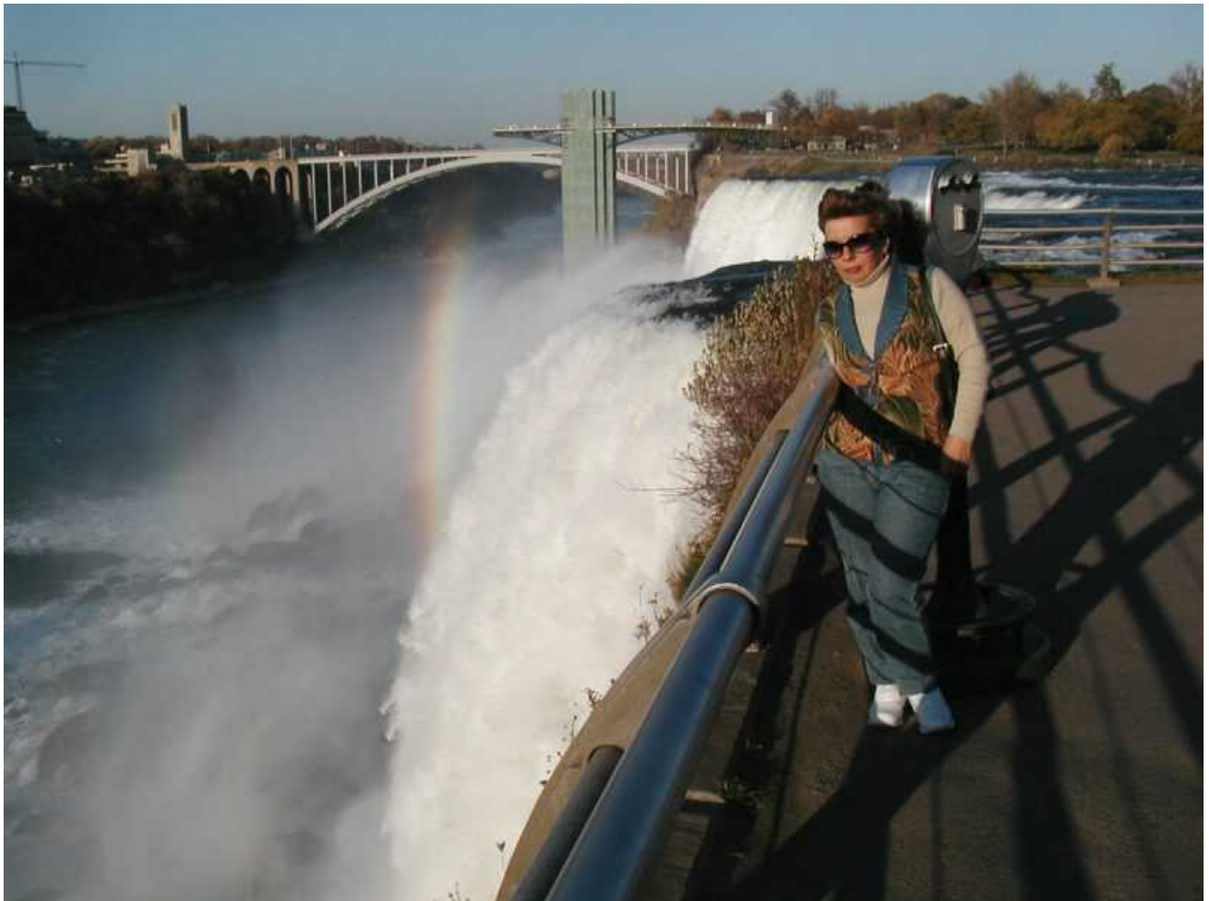
Вид на мост в Канаду и Ниагарский водопад с американской стороны

С американской стороны город «Ниагарский водопад» представляет собой страшное захолустье – бедное и пыльное. Лишь у водопада разбит парк, да сверкает стеклами мост в Канаду.