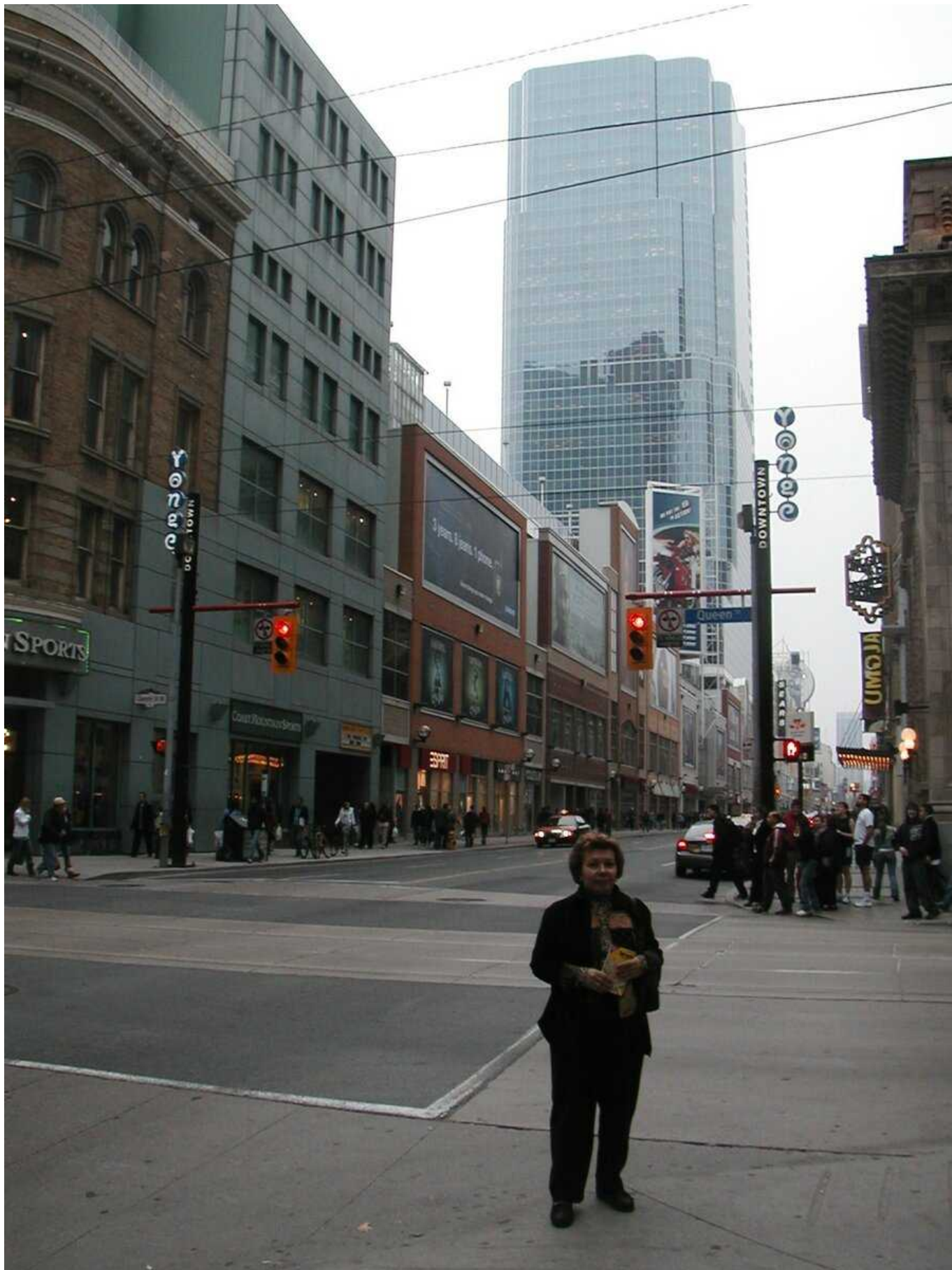
На улицах Торонто